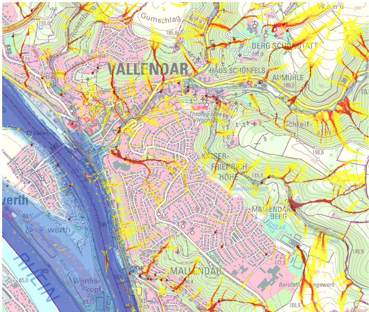
Abbildung 4.2: Ausschnitt von Vallendar mit Informationen aus der Starkregenhinweiskarte des Landes RLP [1]

In der Stadt Vallendar wird die Starkregengefährdung gemäß des HWIP als hoch eingestuft, was in Anbetracht der bislang bei Starkregenereignissen aufgetretenen Schäden sowie der Auswertung im Rahmen der Konzepterstellung bestätigt werden kann.