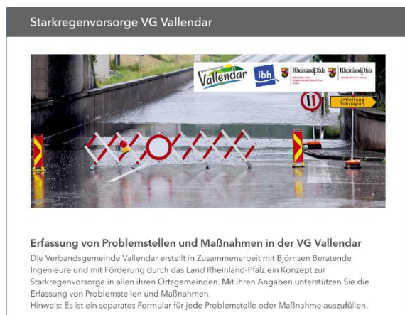
Abbildung 3.1: Ausschnitt der Web-Anwendung zur Verortung von Hochwasser- und Starkregen-Problemstellen und -Maßnahmen in den betrachteten Ortsgemeinden.