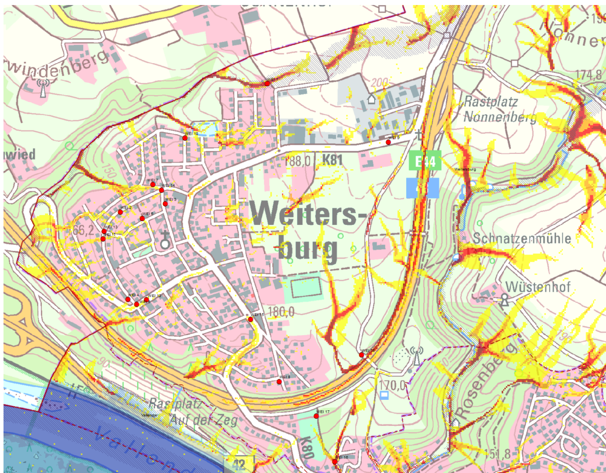
Abbildung 4.1: Ausschnitt von Weitersburg mit Informationen aus der Starkregenhinweiskarte des Landes RLP [1]

Gemäß Karte 5 des Geoportals Rheinland-Pfalz liegt für Weitersburg lediglich eine mäßige Starkregengefährdung vor, was vermutlich darauf zurückzuführen ist, dass ein großer Teil der Ortslage eher Charakterzüge einer Hochebene aufweist. In Weitersburg stellen daher weniger die von außen auf die Ortslage treffende Abflusskonzentrationen ein Risiko hinsichtlich starkregeninduzierter Sturzfluten dar, sondern eher die Konzentrationen, die sich innerhalb der besiedelten Ortslage ausbilden und sich anschließend in Richtung der tiefer gelegenen Randbereiche der Ortslage fortentwickeln.